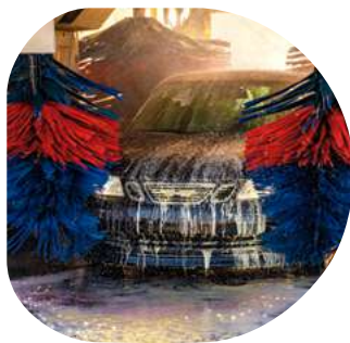
Stations de lavage

C'est une solution efficace et flexible pour ceux qui souhaitent un service intégral dans un minimum d'espace.