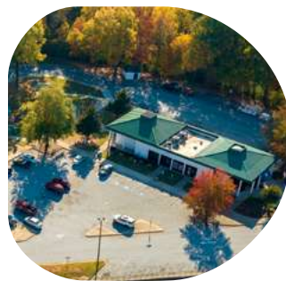
Zones de service