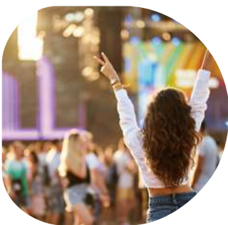
Événements de masse