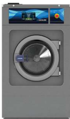
LAVADORA INDUSTRIAL AGUA CALIENTE (1,2kW) WED-18 ET2