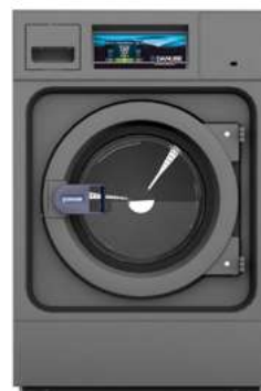
LAVADORA PROFESIONAL AGUA CALIENTE (0,75 kW) WPR-10 ET2