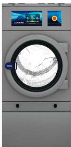
SECADORA INDUSTRIAL ELÉCTRICA (12kW) DD-18 SILVER ET2

Viene de serie con 3 máquinas preconfiguradas para uso en autoservicio: una lavadora industrial de 18 kg, una lavadora profesional de 10 kg y una secadora industrial de 18 kg, todas ellas equipadas con EASY TOUCH 2, listas para conectarse. También ofrece una serie de accesorios opcionales.