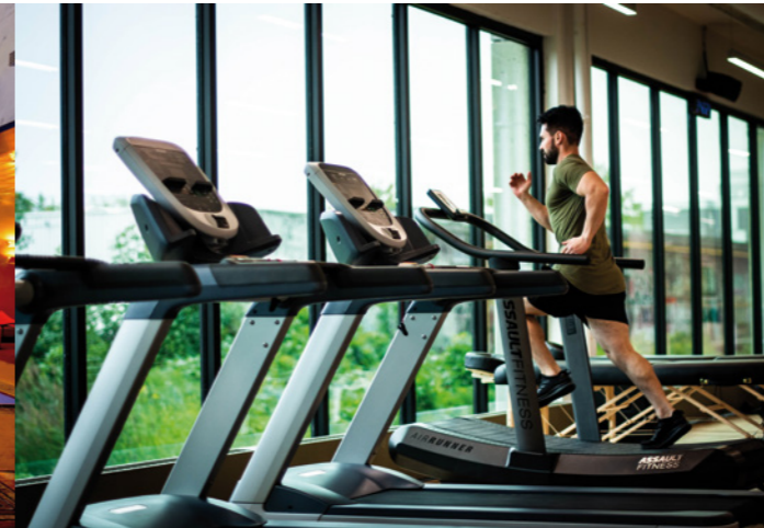
SALLES DE SPORT GYMS