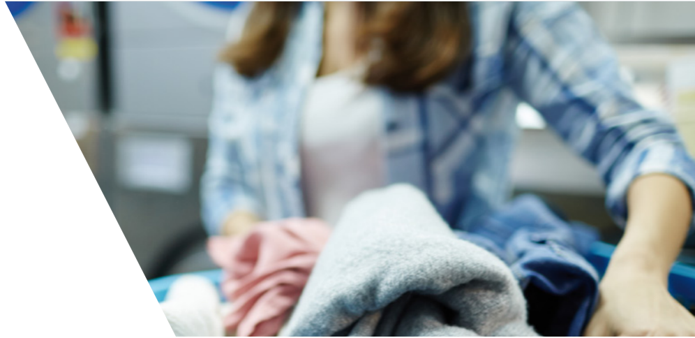
LAVERIES AUTOMATIQUES COIN LAUNDRIES