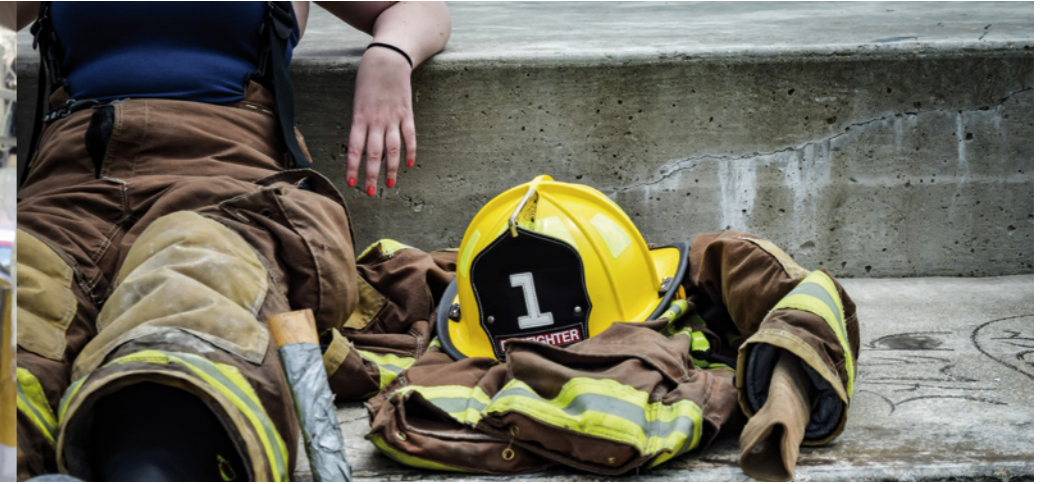
UNIFORMES DE POMPIERS FIRE FIGHTERS