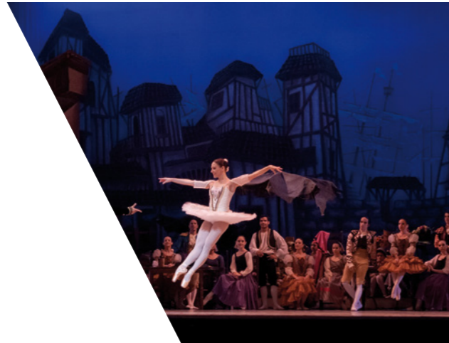
COSTUMES DE SCENE THEATER CLOTHING