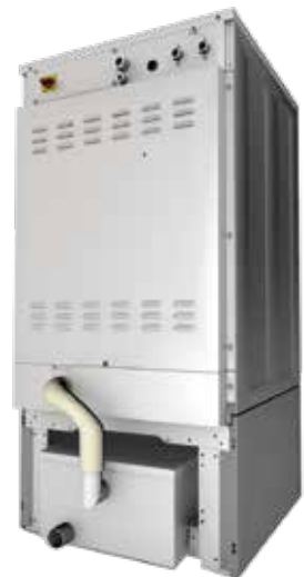
Rehausse pour mops Plinth for mops