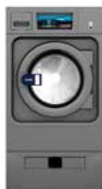
WPR G FACTOR 450