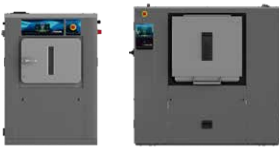
MED G FACTOR 350