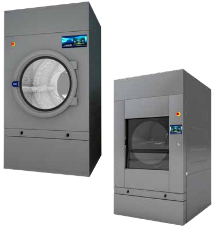
Puerta automática de guillotina

Batería vapor en acero inox (presión hasta 15 bar) Mueble skinplate gris, efecto inox. Transmisión mediante motor-reductor. SPRINKLER - Sistema antiincendios integrado. SOFT DRY - Tambor con perforaciones embutidas. COOL DOWN - Enfriamiento al final del ciclo. Disponibles en calefacción eléctrica, gas o vapor. CE aprobado