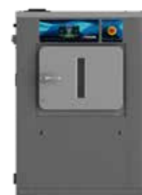
MED G FACTOR 350