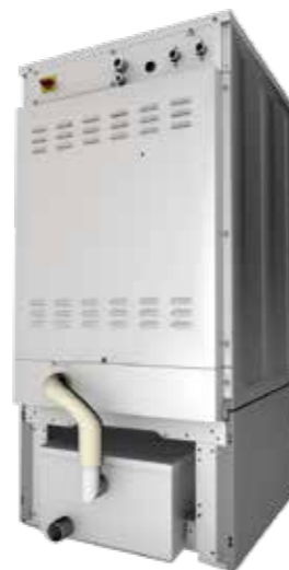
Rehausse pour mops Plinth for mops