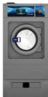
WED G FACTOR 450