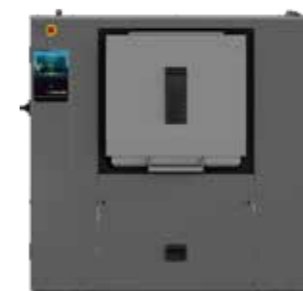
DBW G FACTOR 375