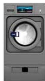
WPR G FACTOR 450